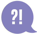
Groeien door feedback